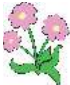
Lóng Rộng Rãi

Các người đã được lãnh không thì hãy cho không. (Ma-thi-ơ 10:8)